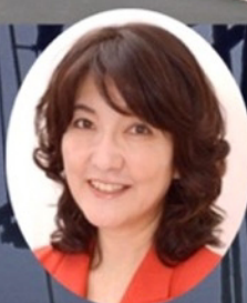
衆議院議員 片山 さつき 元財務省主計局主計官