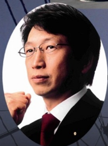
自由民主党衆議院議員 平 将明 第54代(社)東京青年会議所理事長