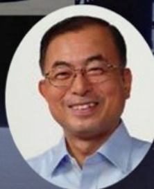
衆議院議員 小野 次郎 元小泉内閣総理大臣秘書官