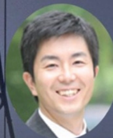
衆議院議員 牧原 秀樹 弁護士・ニューヨーク州弁護士